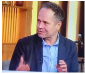
Миодраг Стошић, председник Скупштине